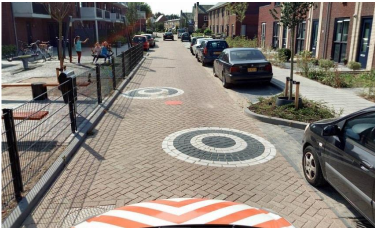
Mini punaises Een cirkelvormige verkeersdrempel